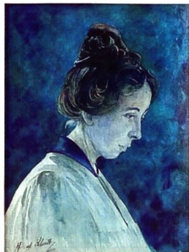
Hilma af Klint: Omakuva.

1980-luvulla Hilma af Klint löydettiin uudelleen. Hänen merkityksensä modernille taiteelle kasvoi nopeasti, ja erityisesti Guggenheimin suurnäyttely (2018) nosti hänet maailman tietoisuuteen. Hilma on