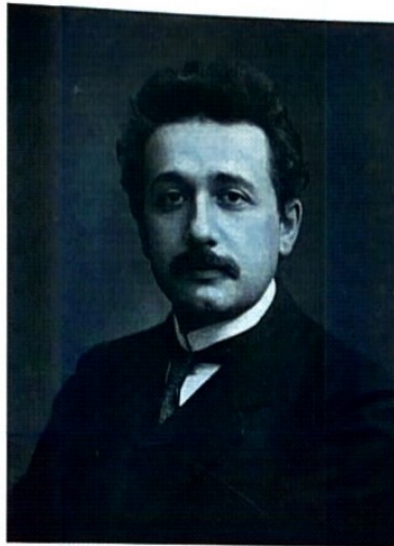
Albert Einstein 1913.

”Weimarin aikani päättyessä oli takanani 36 ikävuotta. Jo vuotta aikaisemmin oli sielussani alkanut syvälinen muutos. Lähtiessäni Weimarista siitä tuli merkittävä kokemus. Se oli täysin riippumaton ulkoisten elinolojen muutoksesta, mikä sekin oli suuri. Kokemus siitä, mitä henkisessä maailmassa voi kohdata, oli minulle aina itsestäänselvyys; aistimaailman havainnoiva ymmärtäminen tuotti minulle mitä suurimpia vaikeuksia. Oli kuin en olisi kyennyt vuodattamaan sielullista kokemista aistielimiin riittävässä määrin yhdistääkseni myös niiden kokemisen täysinmättäisesti sieluuni. Tilanne muuttui täydellisesti 36. ikävuoteni alusta alkaen. Kykyäni havainnoida fyysisen maailman esineitä, olentoja ja tapahtumia muuntui täsmällisemmäksi ja intensiivisemmäksi. Tämä koski sekä tieteellisyyttä että ulkoista elämää. Kun aikaisemmin asianlaita oli se, että omaksuin vaivattomasti suuret tieteelliset yhteydet, jotka on käsiteltävissä hengenmukaisesti, ja aistein havainnoiminen ja etenkin sen muistinvarainen säilyttäminen vaati minulta mitä suurimpia ponnistuksia, niin nyt kaikki muuttui. Aikaisemmin puuttunut tarkkaavaisuus aistein havaittavaa kohtaan heräsi minussa. Yksityiskohdat tulivat minulle tärkeiksi; minulla oli tunne, että aistimaailmalla oli jotakin salattavaa, jota vain se voi salata. Pidin ihanteena siihen tutustumista vain sen avulla, mitä sillä oli sanottavana, ilman että ihminen tuo siihen jotakin ajattelullaan tai muulla sisässään olevalla