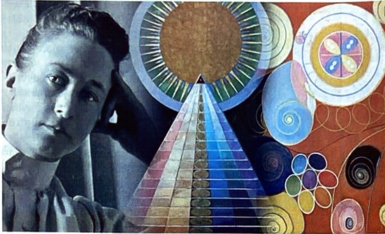
Hilma af Klint (1862–1944).